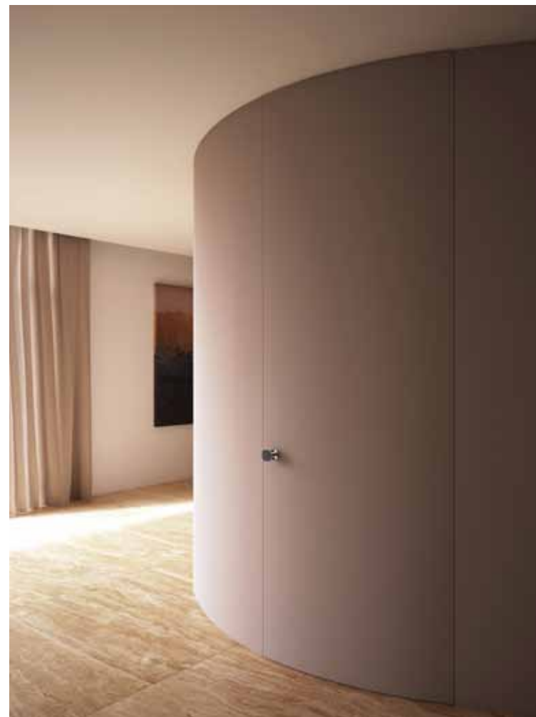
ALBA | PUERTA BATIENTE CURVA | Acabado barnizado como la pared

Nuestra amplia y bien organizada red de equipos especializados de instaladores está disponible en todo el país; su experiencia y profesionalismo están a su servicio para garantizar que nuestros productos sean estéticamente agradables, funcionales y de gran durabilidad.