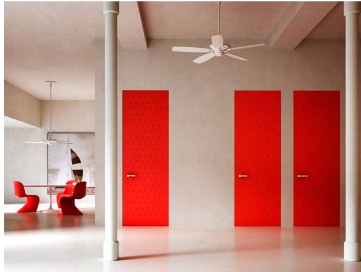
ALBA | PUERTA BATIENTE | Acabado lacado mate y pantografiado

Detrás de nuestro trabajo hay una historia italiana oculta de experiencia y de diseño exclusivo. La pericia técnica precisa está enmascarada por la aparente simplicidad de la puerta al ras de la pared que, combinada con el máximo nivel de «personalización», permite cumplir con los requerimientos estéticos y funcionales más exigentes.